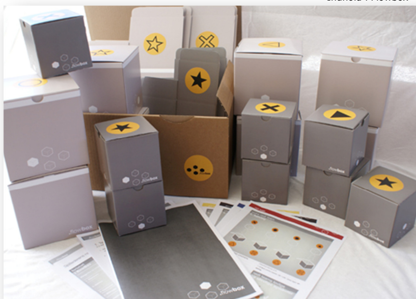
Indhold i Flowbox

Hele spillet inklusiv introduktion, spilletid og opfølgning kan spilles på kun 1 time.